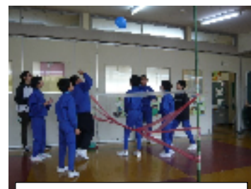
5・6年生 風船バレー