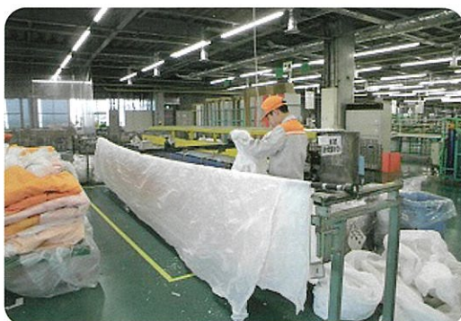
製造業の会社での就業体験

1年生は2週間の校内実習、2年生は2週間、3年生は3週間の就業体験を1学期と2学期に行っています。企業や福祉作業所等で職場の人と一緒に働く体験を通して、将来の職業生活に適應する力を育てます。