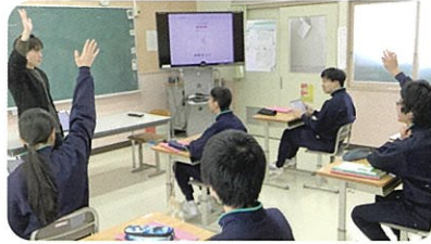
社会：私たちの生活と政治

国語、社会、数学、理科、音楽、美術、保健体育、職業、家庭、外国語、情報の学習を通して、日常生活に必要な基礎的・基本的な内容を習得します。