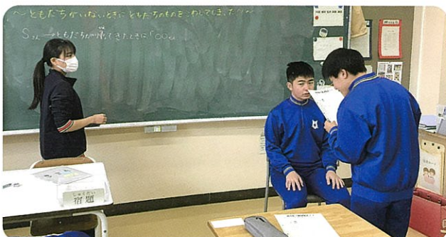
コミュニケーションの学習