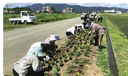
地域交流 花の苗植え(高等部)