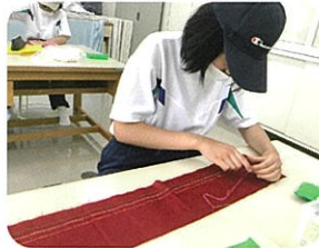
服飾工芸班：刺し子

園芸・食品加工班、木工班、窯業班、産業基礎班、生活サービス班、服飾工芸班、食物班、生活基礎班、受注班、クリーンサービス班の10班に分かれています。作業活動を通して、職業生活や社会生活に必要な力を育てます。