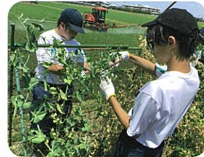
園芸・食品加工班：野菜の収穫