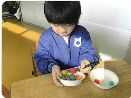
手先の動きや目と手の協応動作の向上をねらったスプーンすくいの学習