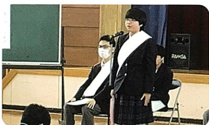
児童生徒会役員選挙

児童生徒会執行部、ベルマーク委員会、図書・放送委員会、保健・給食委員会、体育委員会、美化委員会が月1回活動を行っています。