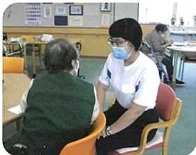
生活サービス班：老人保健施設での実習