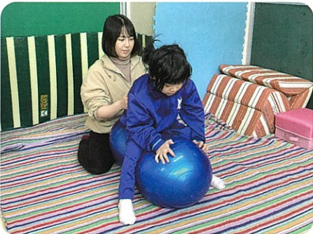
姿勢の保持やバランス感覚の向上をねらったバランスボール運動

身体の動き、コミュニケーション、人間関係の形成など、一人一人の実態や目標に応じた課題や活動に取り組みます。心と身体のバランスの良い発達を目指しています。