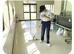
クリーンサービス班：校内清掃