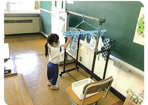
お手伝いをしよう

生活上の目標や課題を達成するための活動を通して、自立的な生活に必要な事柄を実際の・総合的に学習します。