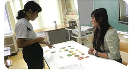
英語：ALTとのやりとり