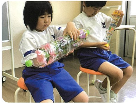
音楽：「手作り楽器で鳴らそう」