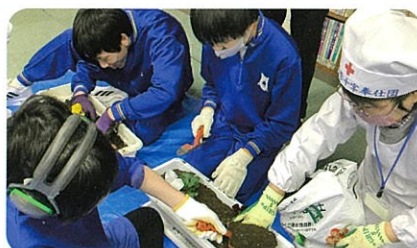
赤十字奉仕団との交流(中学部)