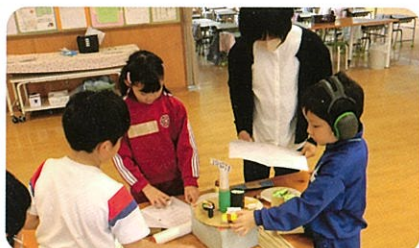
城端小学校との交流(小学部)

地域の学校や地域の方々と一緒に、いろいろな活動をとおしてふれあい交流を行っています。