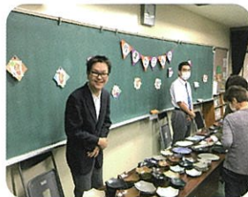
学習発表会「作業製品販売」