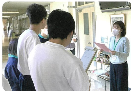
社会参加ときまり：聞いてみよう、職場での決まり

生活に基づいた目標や課題を達成するための諸活動を通して、将来の社会生活に必要な知識や技能を習得します。